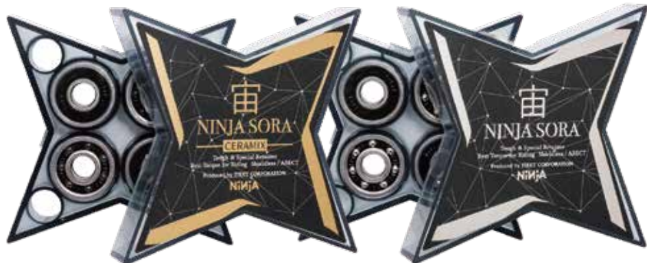
SORA CERAMIX ¥16,500 (with tax)