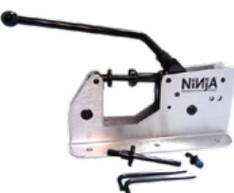
Bearing Press machine ¥4,620 (with tax)