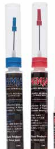
Speed OIL pen type (blue/red) bottle type (red) ¥1,100 (with tax) ¥440 (with tax)