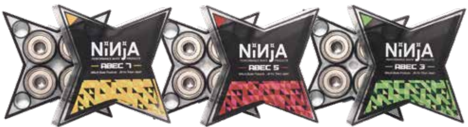
ABEC7(OIL)/star ¥3,630 (with tax)