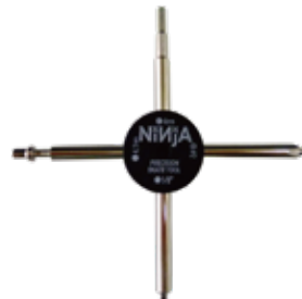
STAR TOOL ¥1,320 (with tax)