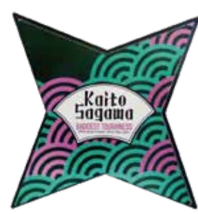
Kaito Sagawa sig. (BADDEST TOUGHNESS) ¥4,180 (with tax)