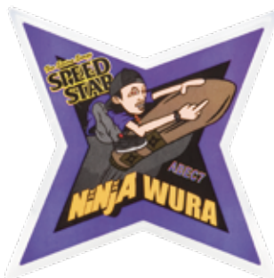
Tomokazu Wura sig. ¥3,630 (with tax)