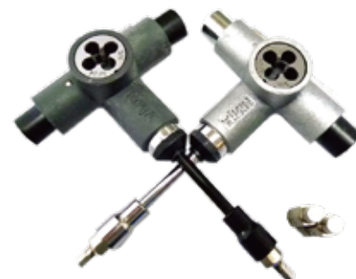
T TOOL PERFECT X black/silver ¥3,190 (with tax)