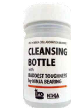
IFO's collabo (BADDEST TOUGHNESS) ¥4,180 (with tax)