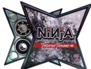
Tatzuma Tamano sig.2 (全シリーズBLACKアクリル) ¥3,630 (with tax)