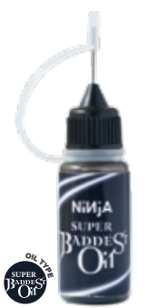
SUPER BADDEST OIL ¥2,079 (with tax)