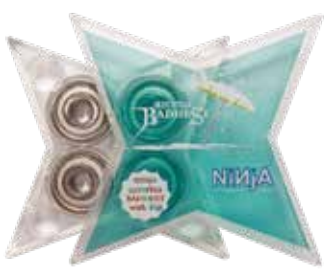
aroma BADDEST with Fiji perfume ¥4,180 (with tax)