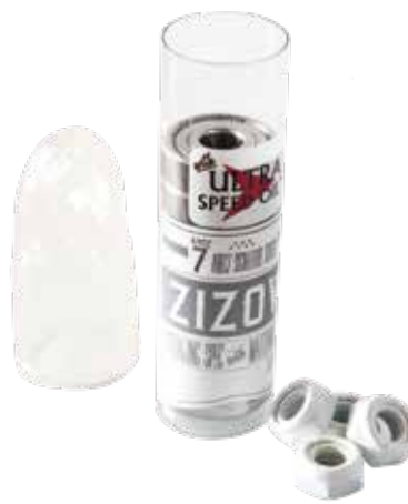
ZIZOW sig. (SUPERALJING with 4nuts white) ¥3,850 (with tax)