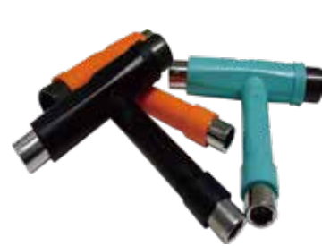
T5 wrench ¥1,100 (with tax)