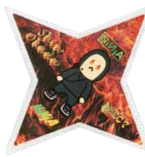
Shin Okada sig. ¥3,630 (with tax)