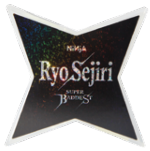
Ryo Sejiri sig. (SUPER BADDEST) ¥4,180 (with tax)