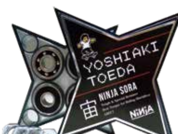
Yoshiaki Toeda sig.2 (SORA with Axle nuts) ¥5,280 (with tax)