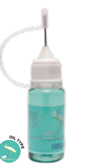
aroma BADDEST OIL ¥2,079 (with tax)