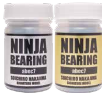
Soichiro Nakajima sig. (OIL/walrus /green) /oil ¥3,630 (with tax)