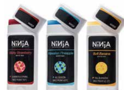
WAX Strawberry / Pineapple / Banana ¥550 (with tax)