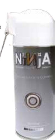
BEARING CLEANER ¥1,540 (with tax)