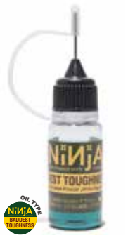
BADDEST TOUGHNESS OIL ¥2,079 (with tax)