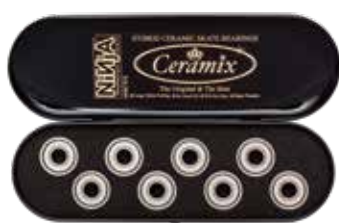
CERAMIX ¥14,960 (with tax)