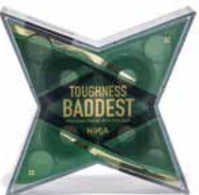
BADDEST TOUGHNESS ¥4,180 (with tax)