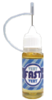
VERY VERY FAST OIL ¥2,079 (with tax) (BADDEST系最強OIL。摩擦抵抗を極限まで抑制)