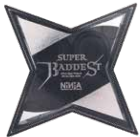
SUPER BADDEST ¥4,180 (with tax)