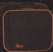
Carry Case デモンドライブペダルに付属の、丈夫なセミハード・タイプの専用ケース。

防振ゴムを内蔵し不要な高域のオバートーンと振動を抑え、パワーの伝達性を高めた、コントロールコア・フェルトビーターを標準装備。また、ウッドビーターもオプションで。 (PAT. PEND)