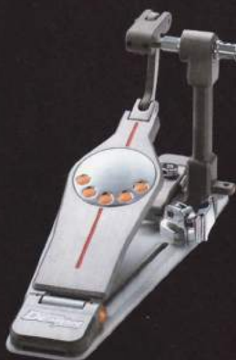
ELIMINATOR DEMON DRIVE DOUBLE PEDAL