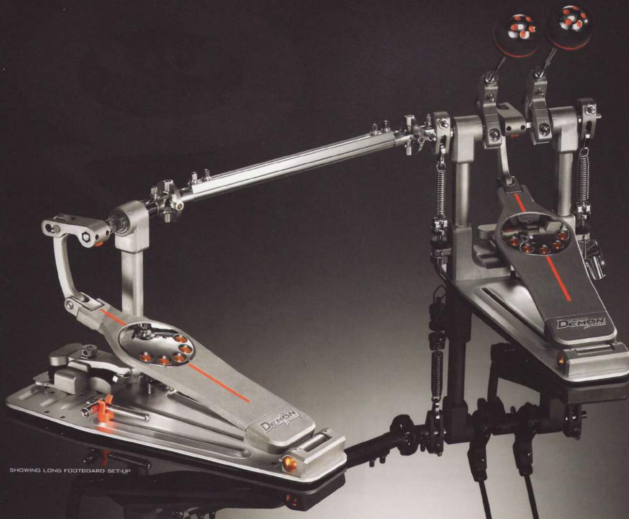
SHOWING LONG FOOTBOARD SET-UP

Designed for skateboarding these bearings feature micro-polished steel balls for amazing low friction.